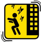
落ちてくるものにちゅうい