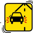
ハザードランプをつけて減速