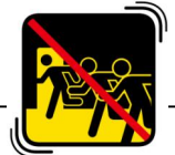
あわてて外にとびださない