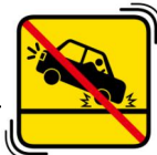
急ブレーキをかけない