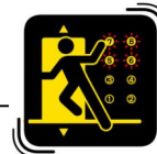
近くの階でおりる