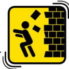
へいからはなれる